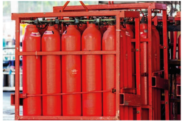
Stockage sous pression du dihydrogène.

> Stockage sous forme solide : le dihydrogène est conservé sous forme d'hydrogène atomique au sein d'un autre matériau, comme certains alliages métalliques (FeTi). Cette méthode met en jeu des mécanismes d'absorption de l'hydrogène par le matériau.