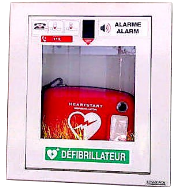
Un défibrillateur installé en lycée

L'objectif de cet exercice est de comprendre le fonctionnement d'un défibrillateur au travers d'un modèle simplifié.