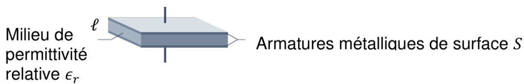
Figure 2 : Représentation schématisée d'un condensateur plan

Le capteur d'humidité comprend un condensateur plan pouvant être schématisé de la manière suivante ( figure 2 ) :