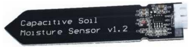
Figure 1 : Photographie d'un capteur d'humidité

Afin de faciliter la gestion de l'arrosage de ses plantes, un botaniste amateur investit dans une série de microcontrôleurs, de capteurs d'humidité et de pompes afin d'automatiser l'apport en eau de ses plantes ( figure 1 ). Son idée est la suivante : le capteur remonte au microcontrôleur une mesure de l'humidité relative du milieu et, dès que celle-ci est inférieure à un seuil qu'il a préalablement décidé, cela déclenche une action, par exemple une alarme ou bien encore l'arrosage de la plante.